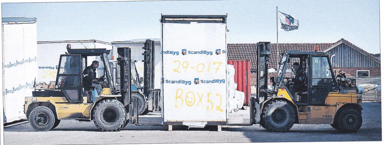
MODULERNE, DER til rejsen er pakket ind i beskyttende plast, hejses om bord på fragtskibet i Løgstør Havn med mobilkran.