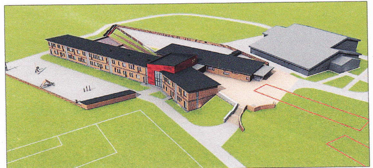
SÅDAN KOMMER skolen til at se ud, når den står færdig til sommer. Illustration: Acanthus Architects

» Man kan godt diskutere, hvor smarte reglerne er. I stedet for, at folk er på nedsat tid og stadig har tilknytning til arbejdsmarkedet, går flere fuldt ledige.